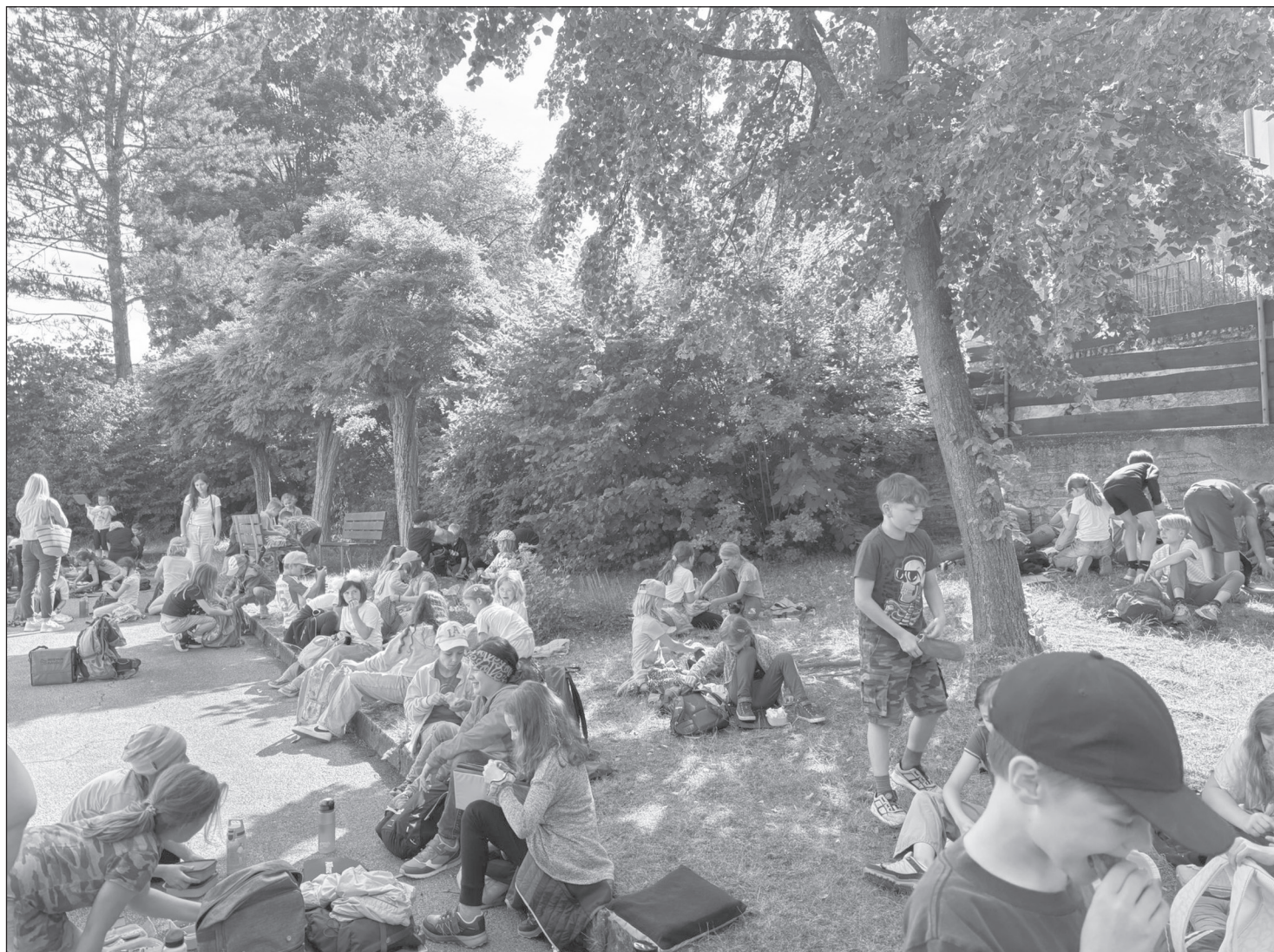
Zum Schluss ging es auf den Spielplatz, wo sich die Kinder noch richtig austoben konnten.

Der Elternbeirat der Grundschule Wolfsegg