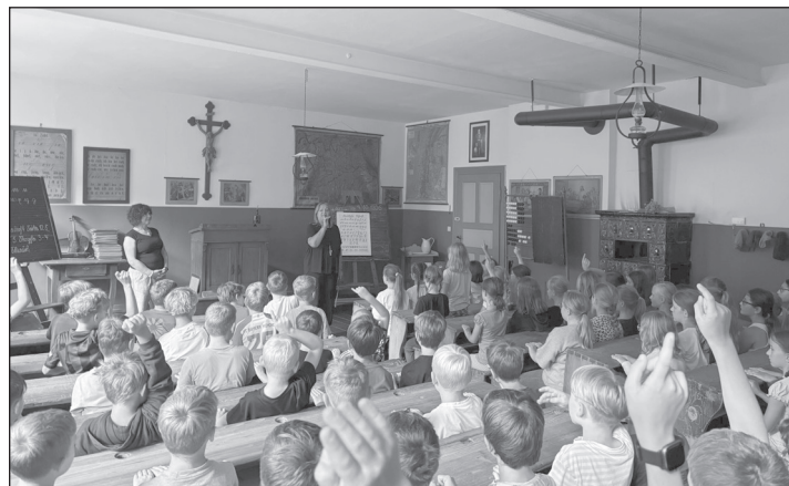
Einen Unterricht wie vor hundert Jahren auf Holzbänken durften die Kinder erleben.

Zum Abschluss des Ausflugs durften sich alle noch auf dem nahegelegenen Spielplatz austoben – ein gelungener Ausklang für einen lehrreichen und fröhlichen Tag.