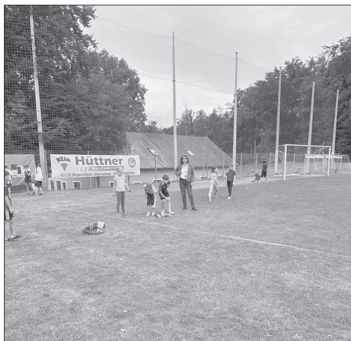
Mit viel Motivation ging es auf den Sportplatz, wo beim 50 Meter Lauf oder beim Weitsprung viele Punkte gesammelt werden konnten für die begehrten Urkunden.