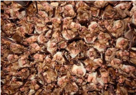
Mausohr-Kolonie in Feldkirchen

Sie ist ein typischer Untermieter in großen Dachstühlen, bei uns haben die ungefähr 300 Weibchen ihre Kinderstube in der Klosterkirche (erste Zählungen ergaben 1987 an die hundert Tiere; ein Maximum erreichte die Population 1999 mit fast tausend). Die Männchen halten sich auch in Hohlräumen an Gebäuden, hinter Fensterläden, in Nistkästen oder auch Fledermauskästen auf.