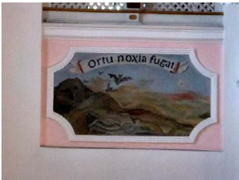
Fledermausfresko in der Klosterkirche

Von dort aus schwärmen sie in der Abenddämmerung zur Nahrungssuche aus. Und sie tun es weniger nach allgemeiner Fledermausart, indem sie die Beute (Insekten, Nachtfalter) mit ihrer Echoortung fangen, sondern bevorzugt am Boden durch die Geräusche, die flugunfähige Käfer, Insekten oder Spinnen verursachen und durch ihren Geruchssinn!