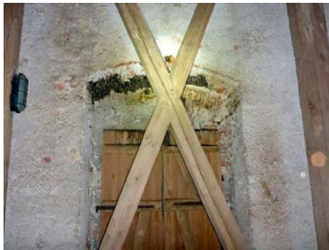
Kirche Pielenhofen 2020